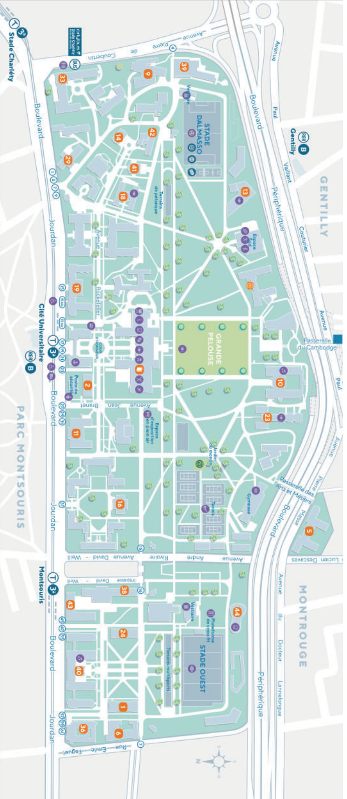
Design: LUCIOLE - Maquette: sifur Gomet